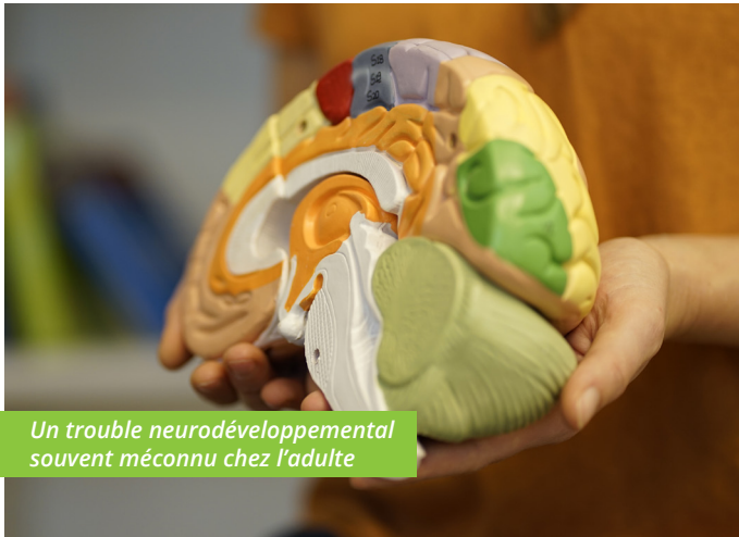
Un trouble neurodéveloppemental souvent méconnu chez l'adulte

Nous savons aujourd'hui que le trouble de l'attention avec ou sans hyperactivité (TDAH) peut persister à l'âge adulte, affectant environ 2,5 à 5 % de la population mondiale. Les principaux symptômes incluent l'inattention, l'hyperactivité et l'impulsivité, ainsi qu'une dérégulation émotionnelle et des troubles dysexécutifs comme la désorganisation. La manifestation du TDAH peut évoluer avec l'âge, prenant différentes formes et intensités. Le TDAH est souvent associé à d'autres troubles psychiatriques.